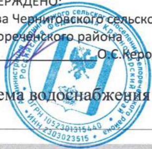
СХЕМА ВОДОСНАБЖЕНИЯ ст-цы ЧЕРНИГОВСКАЯ